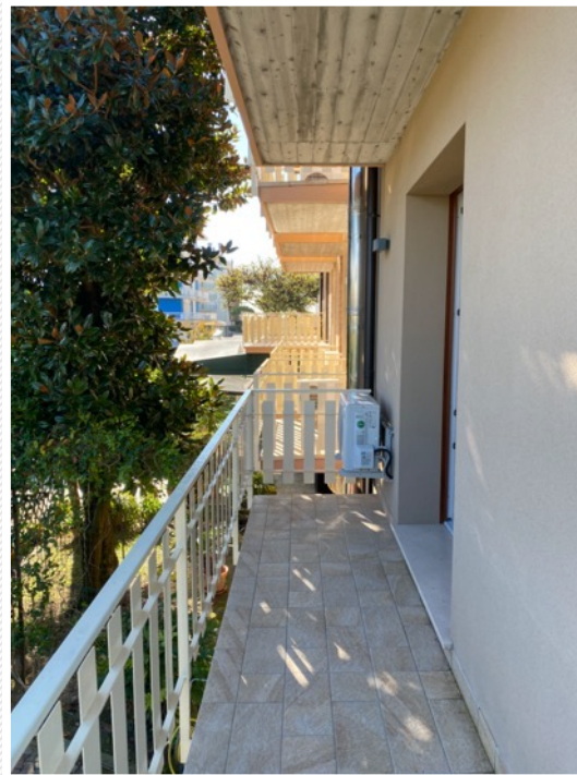
1. und 2. Stock: Zimmer mit Balkon.