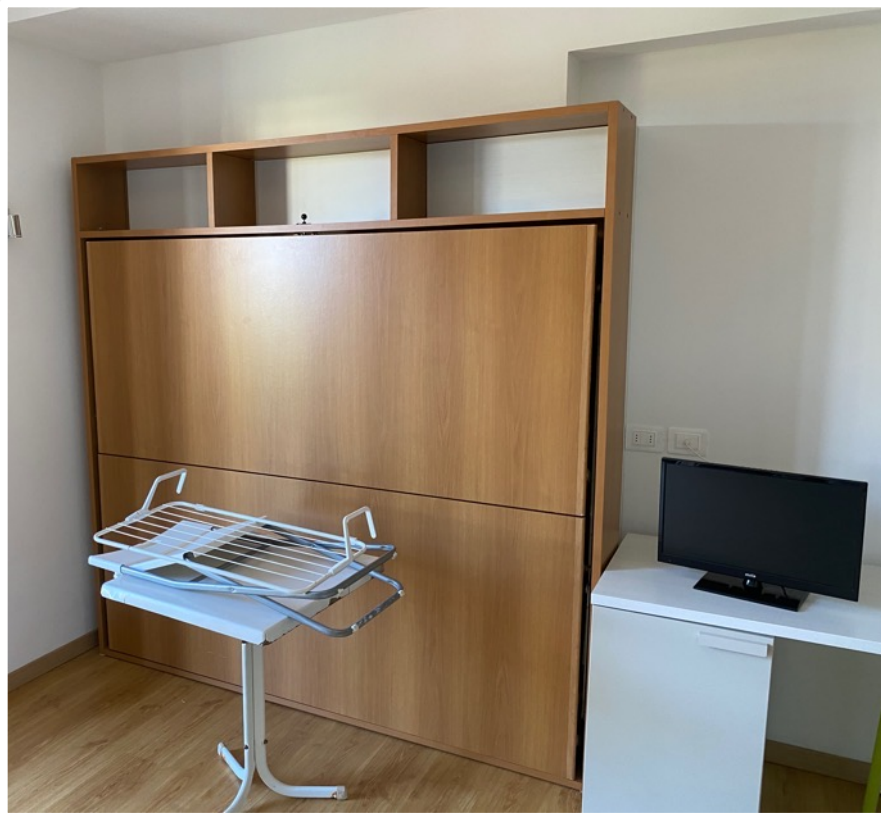
1. und 2. Stock: 6 Zimmer mit Erweiterungsbett für bis zu 4 Personen.