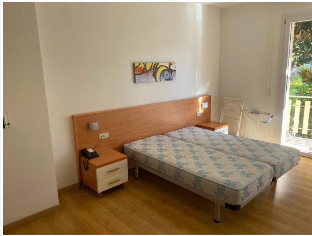
1. und 2. Stock: Komfortzimmer mit Doppelbett, Schrank, Schreibtisch, Dusche, Toilette sowie tw. Bidet