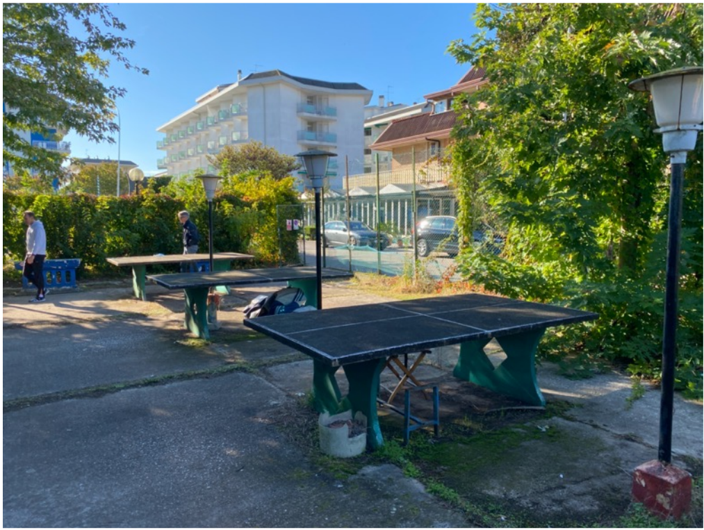
Allwetter-Tischtennisplatten gegenüber vom Hotel zum Spielen nutzbar

Im Aufenthaltsraum können bei Bedarf eine Indoor-Tischtennisplatte und ein Kicker aufgestellt werden (muss selbst mitgebracht werden!)