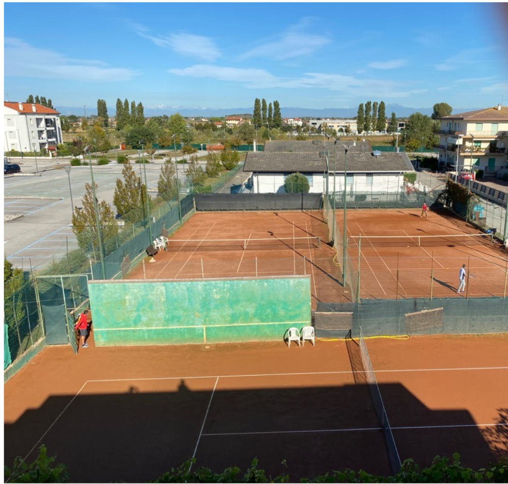
Plätze 2 + 3 (Doppelfelder)